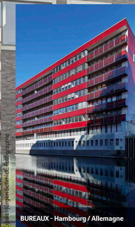
BUREAUX - Hambourg / Allemagne