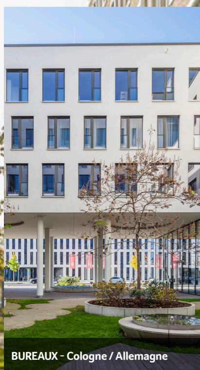
BUREAUX - Cologne / Allemagne

Conformément à la réglementation en vigueur, le client peut recevoir, sur simple demande de sa part auprès du distributeur, des précisions sur les rémunérations relatives à la commercialisation du présent produit. Pour plus d'informations sur les frais, il convient de se reporter au chapitre 3 sur les frais figurant dans la note d'information de la SCPI. L'ensemble des documents : Note d'information, Statuts, dernier rapport annuel, dernier bulletin d'information semestriel, le Document d'Informations Clés (DIC) et la notice d'information sur la protection des données personnelles doivent être remis avant toute souscription et sont disponibles en français sur le site internet www.aewpatrimoine.com .