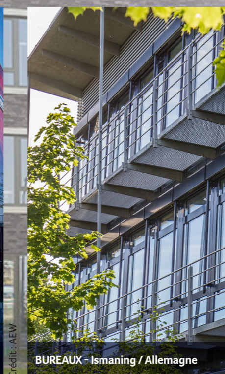
BUREAUX - Ismaning / Allemagne

Photo : bureaux - Cologne / Allemagne - Acquisition 2021